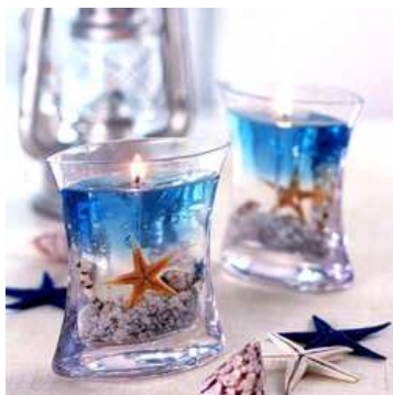
- شمع مایع