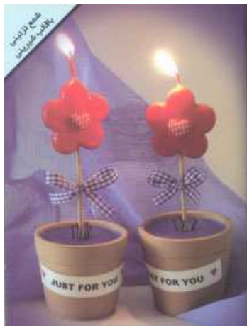
نکته‌های مهم در شمع‌سازی

بیشتر افرادی که به شمع‌سازی علاقه دارند از قالب‌های آماده و مختلف برای ساخت شمع‌های خود استفاده می‌کنند.