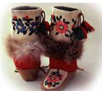
Mukhs with wool shafts, Dene (Slavey), 1971