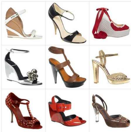
"barneysale" recommendations at TheNext

فندی (Fendi) یکی از قدیمی‌ترین مراکز مد ایتالیاست که در سال ۱۹۲۵ توسط ادواردو و آدله فندی تاسیس شد. در سال‌های اولیه بیشترین فروش آنها مربوط به کیف و کفش‌های دست دوز آدله بود. کمتر از ۱۰ سال بعد فندی با همکاری کارلا لاجرفلد، مدیست معروف به یکی از مراکز معتبر در دنیای مد بدل شد که طراحان از آن به عنوان یکی از پیشرفته‌ترین مراکز مد اروپا نام می‌بردند که نه تنها در زمینه طراحی که حتی برگزاری شوهای کیف و کفش نیز بسیار مطرح شد. در سال ۶۶ اولین خط تولید کیف و کفش فندی در آمریکا و پس از آن ژاپن راه افتاد و در سال‌های بعد نام جهانی به خود گرفت.